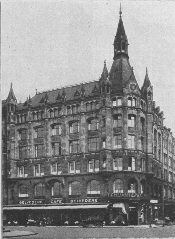
Abb. 817. Belvedere.