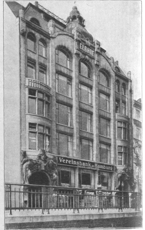
Abb. 819. Elbhof.