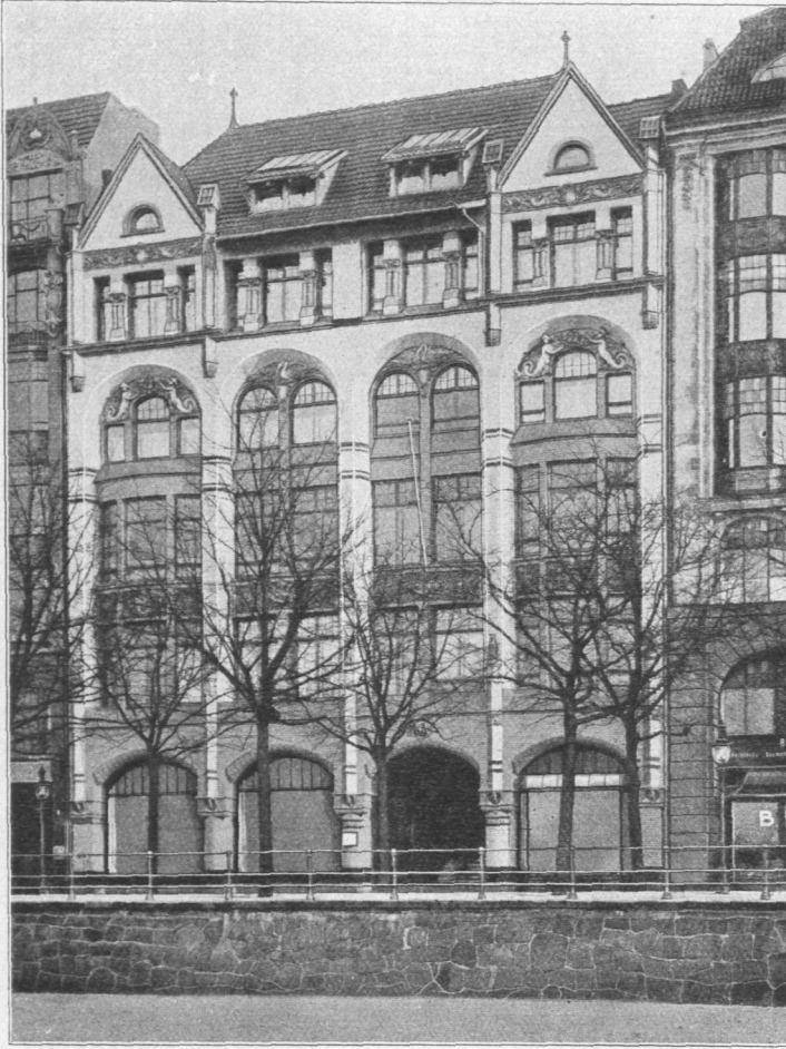
Abb. 815. Alsterdamnhof.