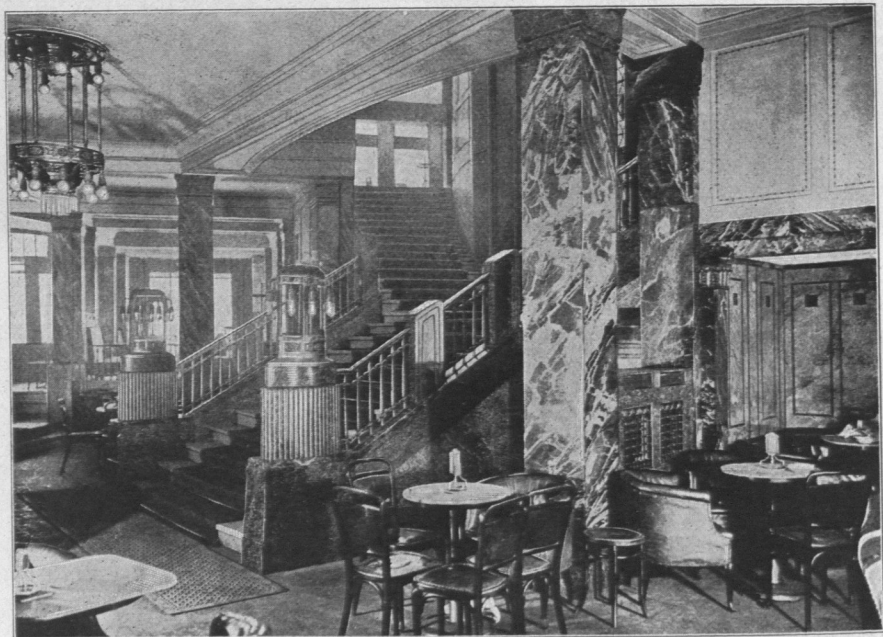
Abb. 786. Rathaus-Café, Aufgang.

Gleichfalls im „Versmann-Haus“ befindet sich das Restaurant Rathaushalle (Abb. 782 und 784), bestehend aus Wirtschaftsräumen in zwei Geschossen. Die Räume sind von L. Piglhein ausgestattet.