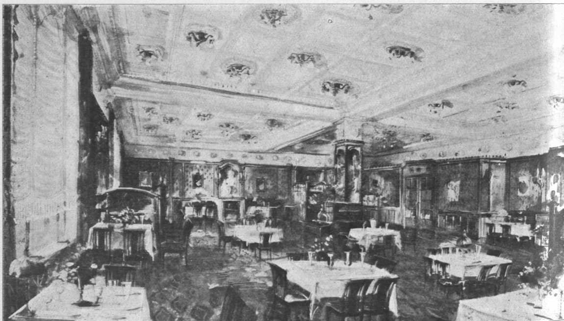
Abb. 761. Restaurant Fischborn, Erdgeschoss.