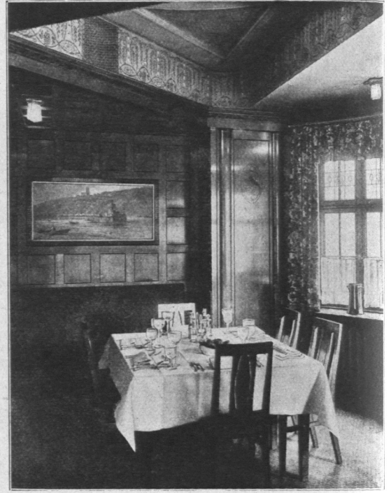
Abb. 746. Rathaus-Hotel, Weinstube.

Als Beispiel der Logierhäuser (Herbergen) ist das 1891 erbaute Logierhaus Concordia (Abb. 747), belegen Reeperbahn 165, wiedergegeben. Eigentümer ist der Verein für Volkskaffeehallen in Hamburg; Architekt war Georg Thielen. Das Gebäude ist ein Logierhaus einfachster Art und enthält außer geräumigen Lese- und Speisefälen, Badeeinrichtung und Waschanstalt 235 Zimmer mit ebenso vielen Betten. S. auch die Herberge im Gewerkschaftshaus (Abb. 716 und 717).