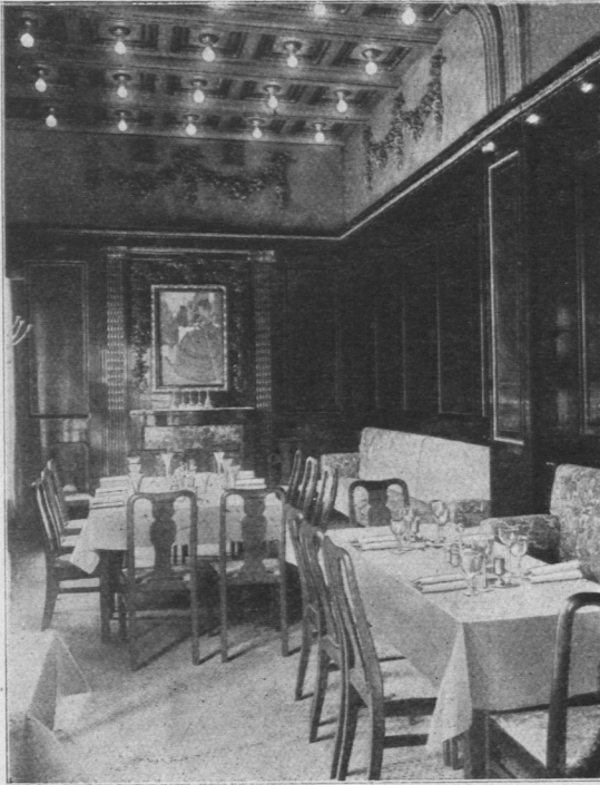
Abb. 745. Rathaus-Hotel, Weinstube.