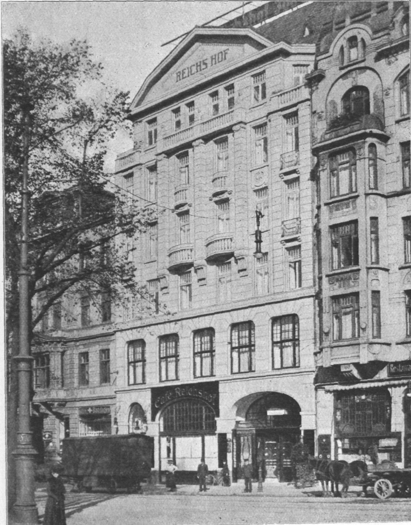
Abb. 739. Hotel Reichshof, Ansicht.