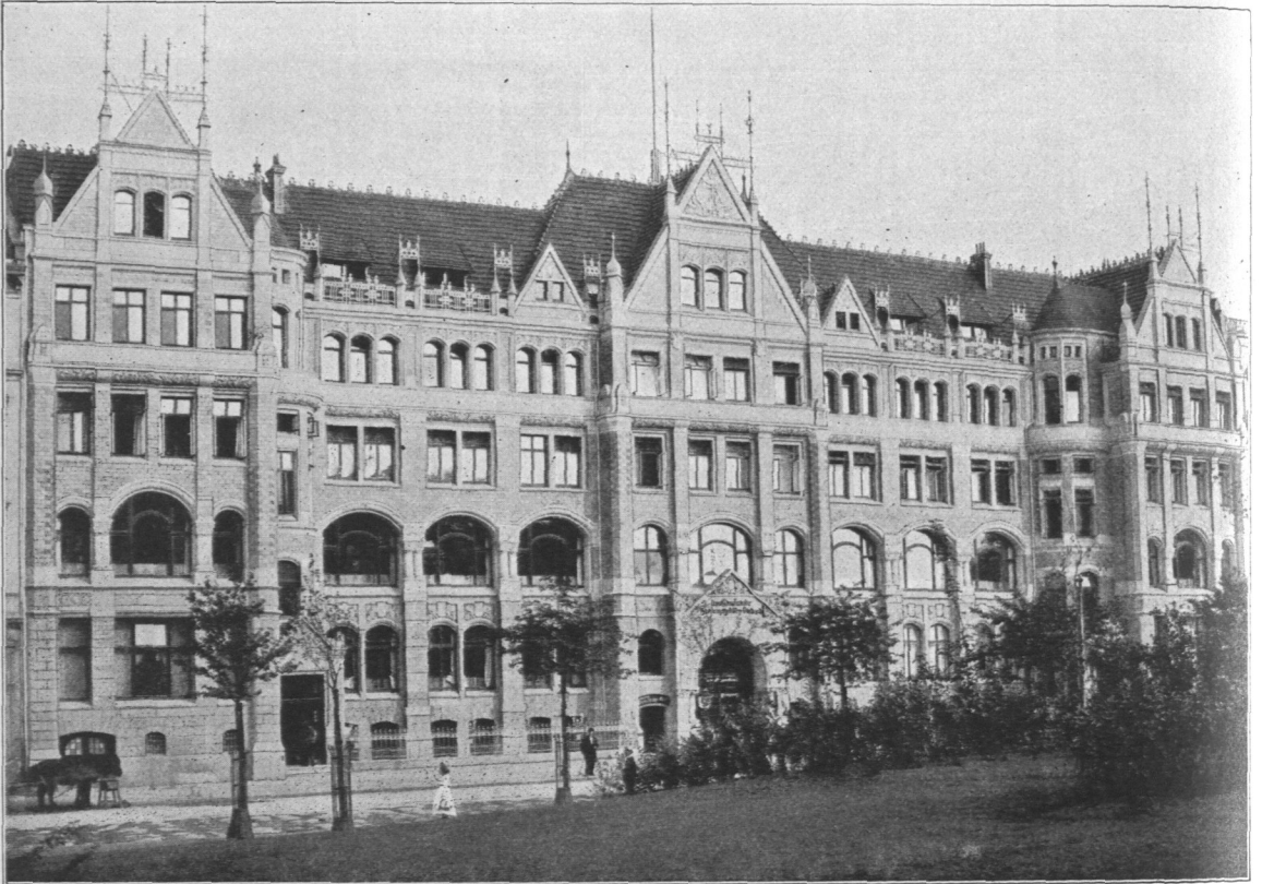
Abb. 712. Geschäftshaus des Deutsch-nationalen Handlungsgehilfen-Verbandes, Ansicht.