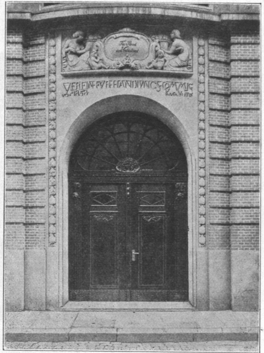
Abb. 709. Geschäftshaus des Vereins für Handlungs-Commis von 1858, Haupteingang.