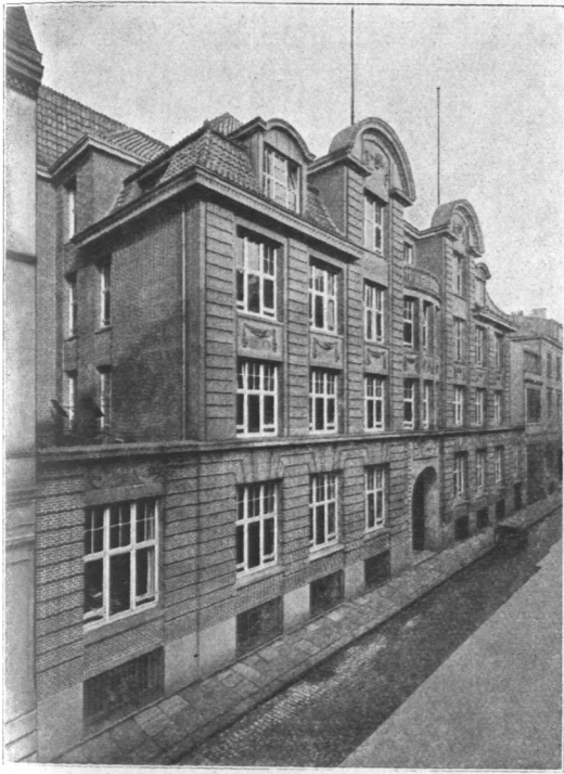
Abb. 708. Geschäftshaus des Vereins für Handlungs-Commis von 1858, Ansicht.