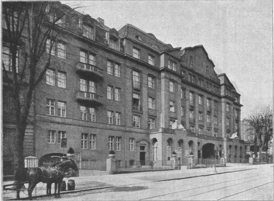
Abb. 695. Curio-Haus, Ansicht.

Das Curio-Haus an der Rotenbaumchauffsee (Abb. 695 bis 701) wurde für die Gesellschaft der Freunde des Vaterländischen Schul- und Erziehungswesens erbaut, die 1805 von dem Lehrer Curio gegründet wurde. Die Anlage zerfällt in drei Teile: an der Straße sind herrschaftliche Wohnhäuser errichtet, dahinter, im Garten, liegt der Festsaalbau und hinter diesem eine Werkstatt für Künstler. Im Festsaalbau befindet sich ein großer Saal für 1200, ein