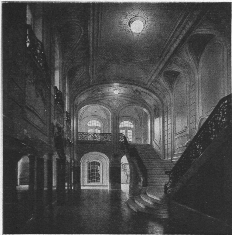
Abb. 670. Musikhalle, Haupttreppe, Ansicht.

Bau einen 5000 qm großen Platz an der Ringstraße, dem Holstenplatz und dem Dammtorwall. Die Ausführung des Baues erfolgte durch die Architekten Martin Haller und Emil Meerwein.