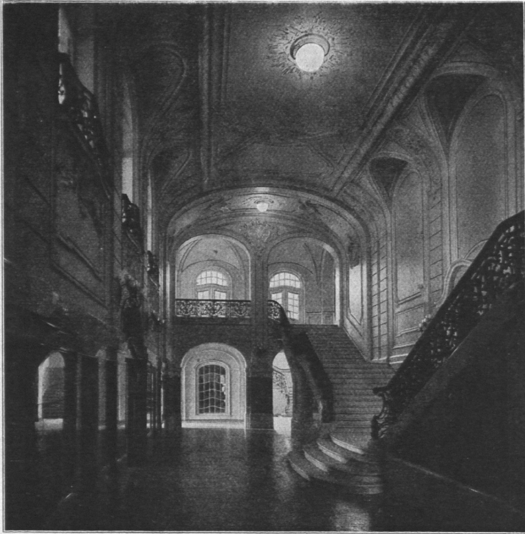
Abb. 670. Musikhalle, Haupttreppe, Ansicht.

Bau einen 5000 qm großen Platz an der Ringstraße, dem Holstenplatz und dem Dammtorwall. Die Ausführung des Baues erfolgte durch die Architekten Martin Haller und Emil Meerwein.