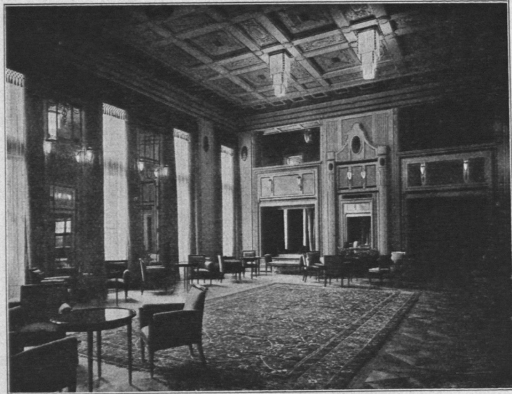
Abb. 646. Thalia-theater, Ansicht des Wandelraumes.

Die Neue Oper. (Abb. 648 bis 651.) Das 1887 bis 1889 für die Gebr. Ludwig erbaute „Konzerthaus Hamburg“ wurde 1908 von den Architekten George Radel, B.D.A., und Franz Jacobssen, B.D.A., zum Hamburger Operettentheater umgebaut. Der Umbau erstreckte sich nur