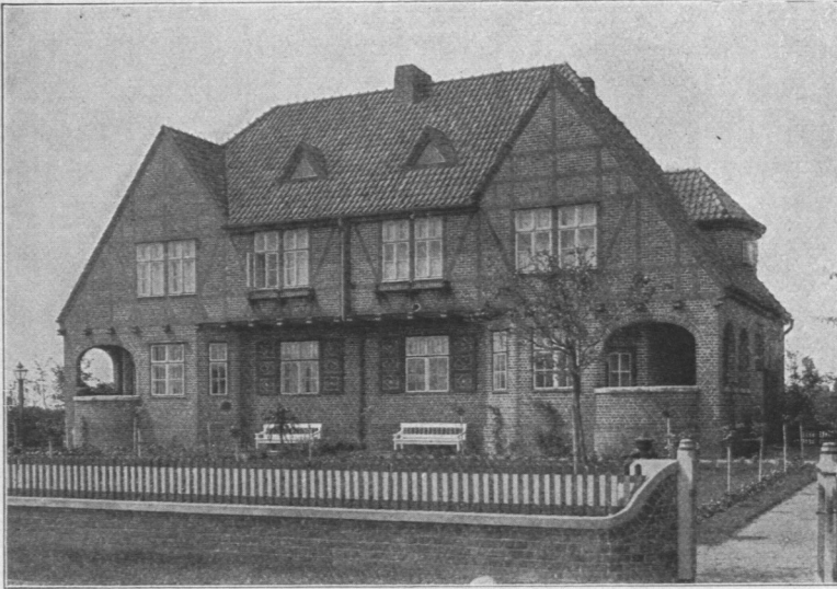
Abb. 634. Werk- und Armenhaus in Farmsen, Beamtenwohnhaus, Ansicht.

und Wäscherei, der Brause- und Wannenbäder und der beiden Gebäude für Leichtkranke mit Warmwasser.