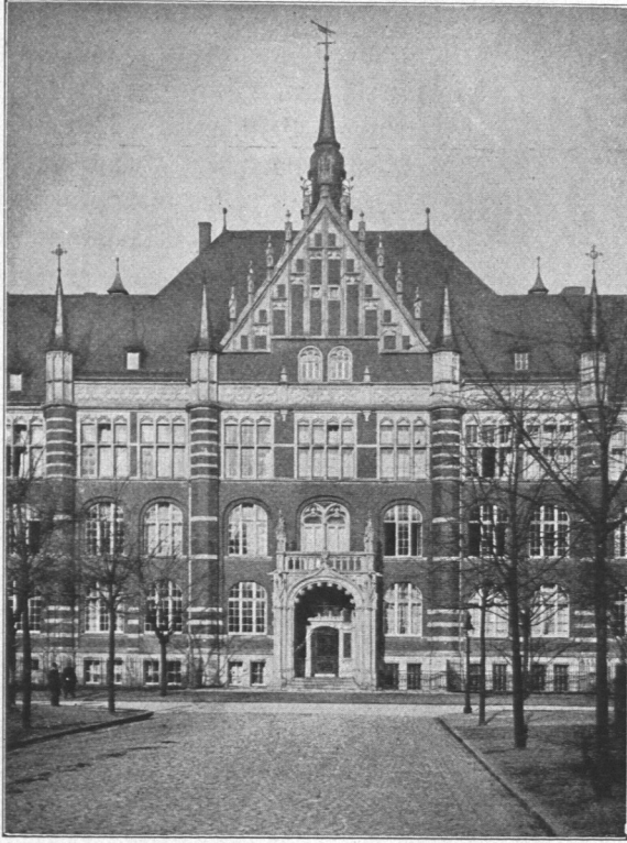
Abb. 615. Verwaltungsgebäude des Waisenhauses, Ansicht.