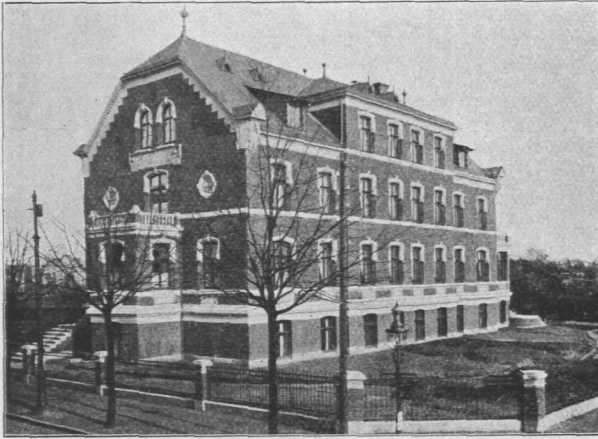
Abb. 611. Ida-Lippert-Stiftung, Schwesternheim Bethanien, Ansicht.

Architekten Hugo Stammann und G. Zinnow.