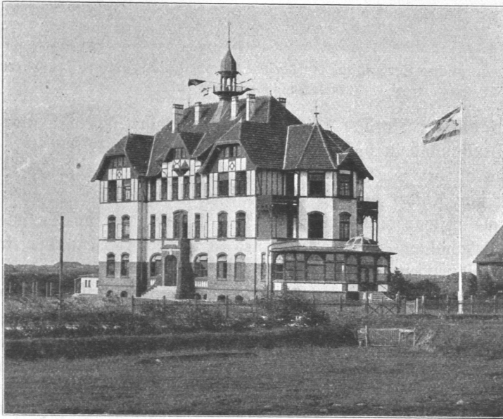
Abb. 593. Israelitisches Kinderhospiz in Duhnen, Ansicht. Architekt Regierungsbaumeister Friedheim, B. D. A.

Alle Gebäude sind aus Stein, meistens mit Steindecken und Steintreppen, mit Sammelheizungen und elektrischer Beleuchtung, äußerlich im ländlichen Baustil mit hölzernen Dachüberständen, Schiefer- bzw. Pfannendächern, teils in Rohbau, teils als Puzbau ausgeführt.