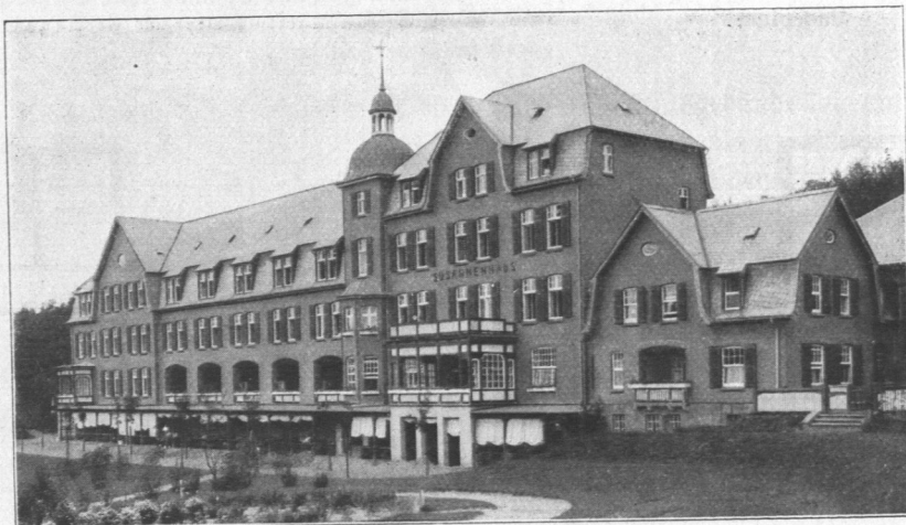
Abb. 591. Heilstätte Edmundothal, Susannen-Haus, Ansicht.

Architekten Martin Haller und Hermann Geißler.