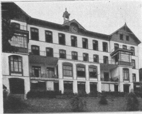
Abb. 589. Heilstätte Edmundothal, Hans-Haus, Ansicht.