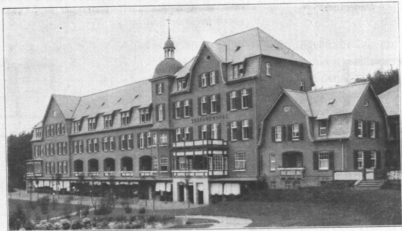
Abb. 591. Heilstätte Edmundothal, Susannen-Haus, Ansicht.