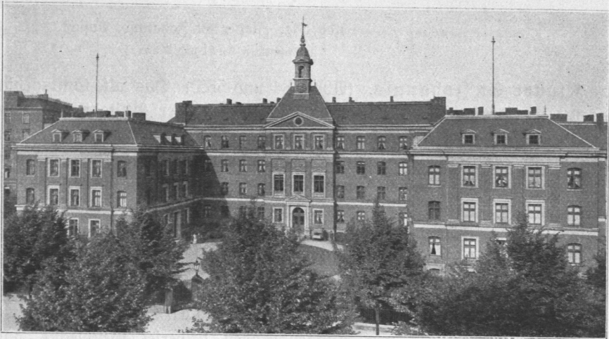
Abb. 582. Daniel-Schutte-Stift an der Alfredstraße, Ansicht. Architekten Martin Haller und Hermann Geißler.