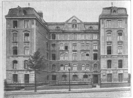
Abb. 579. Dppenheimer-Stiftung, Ansicht. Architekt Regierungsbaumeister Friedheim, B. D. U.