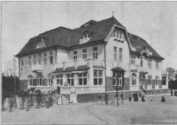
Abb. 578. Selma-Anna-Otto-Heim, Ansicht. Architekt Regierungsbaumeister Friedheim, B. D. U.

Selma-Anna-Otto-Heim. (Abb. 577 und 578.) Dieses Stifft liegt auf dem Gojenberge bei Bergedorf und dient zur Aufnahme in der Heilung begriffener Kinder. Im Erdgeschoß liegen die Spiel- und Arbeitsräume, der Speisesaal, die Zimmer der Oberin und die Küche;