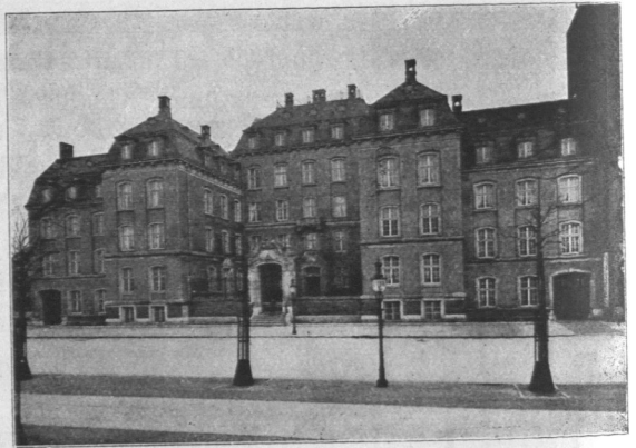
Abb. 571. Heine-Anstl, Ansicht. Architekten Martin Haller und Geißler.