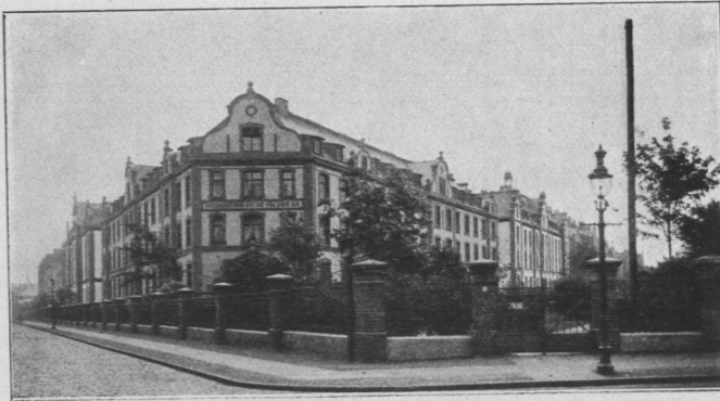
Abb. 565. Vaterstädtische Stiftung von 1876, Ansicht. Architekten Hugo Stammann und G. Zinnow.

Die drei Stiftsgebäude der Vaterstädtischen Stiftung von 1876 (Abb. 565 und 566), an der Schede- und der Frickestraße gelegen, bestehen aus Wohnungen von je einem Zimmer, von je einem Zimmer und Küche und von je zwei oder drei Zimmern und Küche mit je Boden- und Kellerraum. Die Wohnungen werden gegen eine Mietzahlung von wöchentlich 30 Pf. für einen Raum bedürftigen Angehörigen des hamburgischen Staates überlassen.