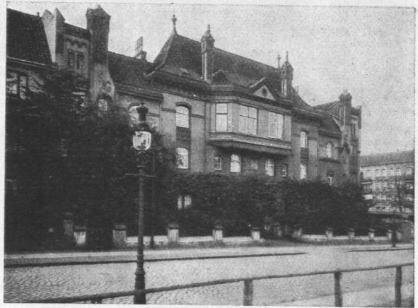
Abb. 551. Dirick-Roster-Testaments-Wohnungen, Ansicht. Architekt Ernst F. Dorn.