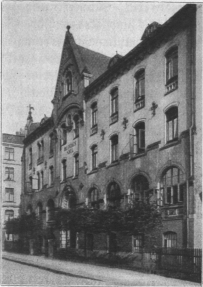
Abb. 549. Blindenanstalt, Ansicht. Architekt Ernst F. Dorn.