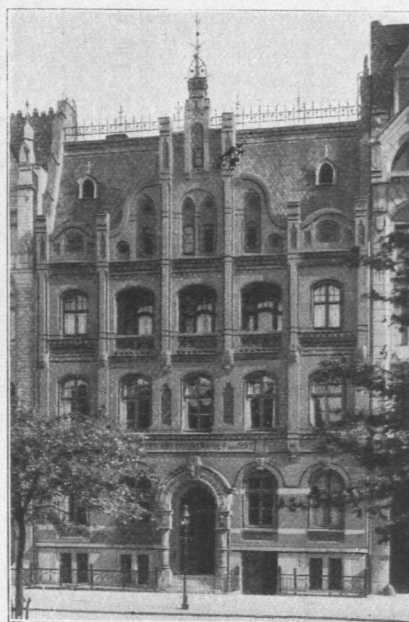
Abb. 543. Kinderbewahranstalt von 1852, Ansicht. Architekten Behr und Eckmann.