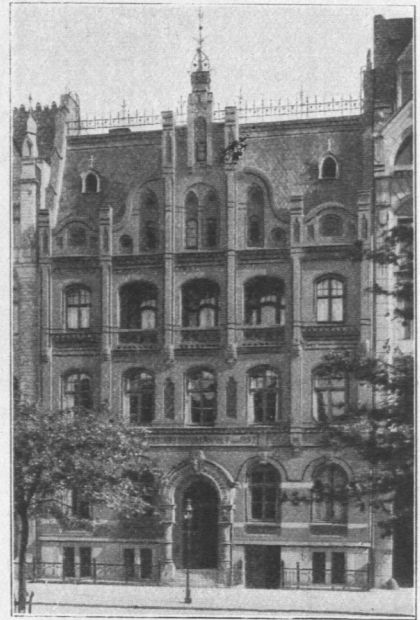
Abb. 543. Kinderbewahranstalt von 1852, Ansicht. Architekten Behr und Eckmann.