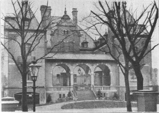
Abb. 541. Jarre-Stift, Ansicht. Architekten Martin Halser und Geisler.