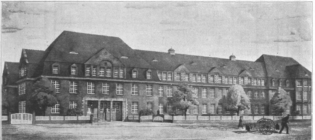
Abb. 470. Institut für Geburtshilfe, Hauptgebäude, Ansicht.

braunroten Ziegeln verblendet, die Hauptgesimse sind aus Beton. Die Dächer haben glanzlose, schwarzgraue Pfannendeckung erhalten. (Abb. 470 und 471.)