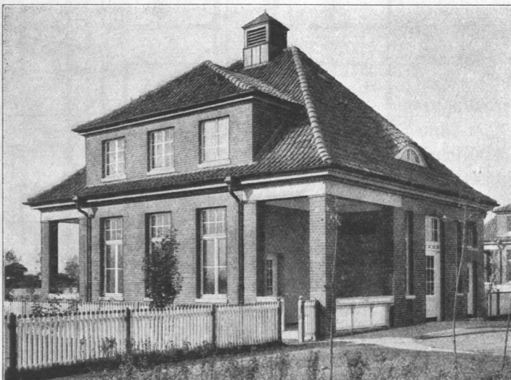
Abb. 452. Allgemeines Krankenhaus Hamburg-Barmbeck, Abgangspavillon, Ansicht.