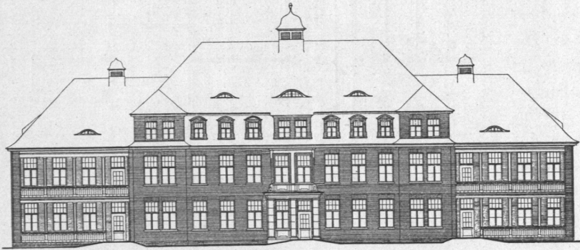
Abb. 439. Allgemeines Krankenhaus Hamburg-Barmbeck, chirurgisch-septischer Pavillon, Ansicht.