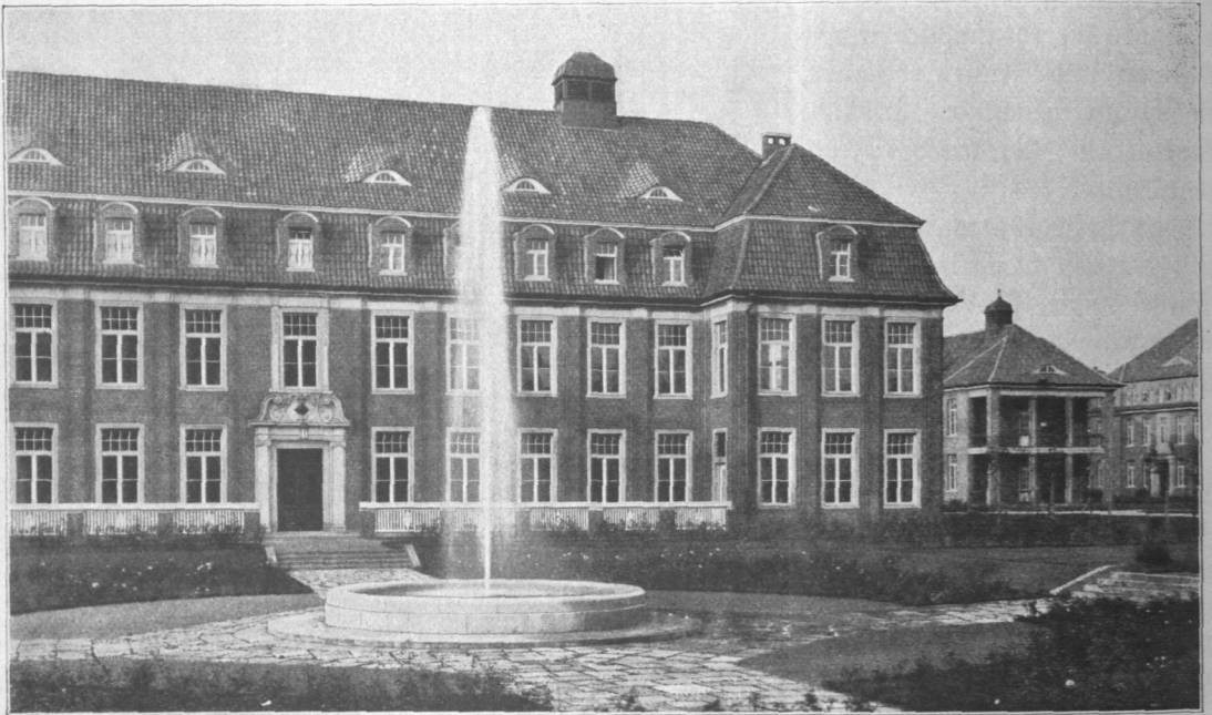
Abb. 427. Allgemeines Krankenhaus Hamburg-Barmbeck, nördlicher Kostgängerpavillon, Ansicht.

krankte (Abb. 442), zwei Pavillons für Lungenkranke, zwei Pavillons für Frauenkrankheiten (Abb. 443) und ein Pavillon für Nasen-, Hals- und Ohrenkranke. Einen Teil des Geländes beansprucht an dieser Stelle das Wohnhaus des ärztlichen Direktors.