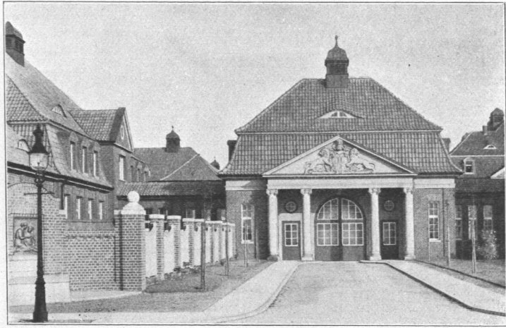
Abb. 425. Allgemeines Krankenhaus Hamburg-Barmbeck, Torgebäude und Aufnahmepavillon, Ansicht.

Zu beiden Seiten der gesamten, nord-südlich sich erstreckenden Mittelgruppe von Gebäuden sind die Pavillonbauten für die allgemeinen, nicht ansteckenden Kranken angeordnet, und zwar auf der südlichen Seite zunächst die aus dem Operationshaus (Abb. 434 und 435) und drei