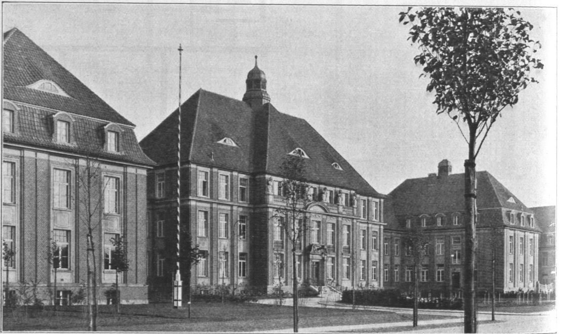
Abb. 423. Allgemeines Krankenhaus Hamburg-Barmbeck, Verwaltungsgebäude, Ansicht.

Schon während des Um- und Erweiterungsbaues der Krankenanstalt St. Georg machte sich das Bedürfnis nach vermehrter Unterkunft für Kranke, d. h. für den Bau eines dritten Allgemeinen Krankenhauses, geltend. Der hierfür ausgewählte Platz an der Fuhlsbüttelerstraße in Barmbeck besitzt eine Größe von 20887 ha und ist rings von Straßen umgeben.