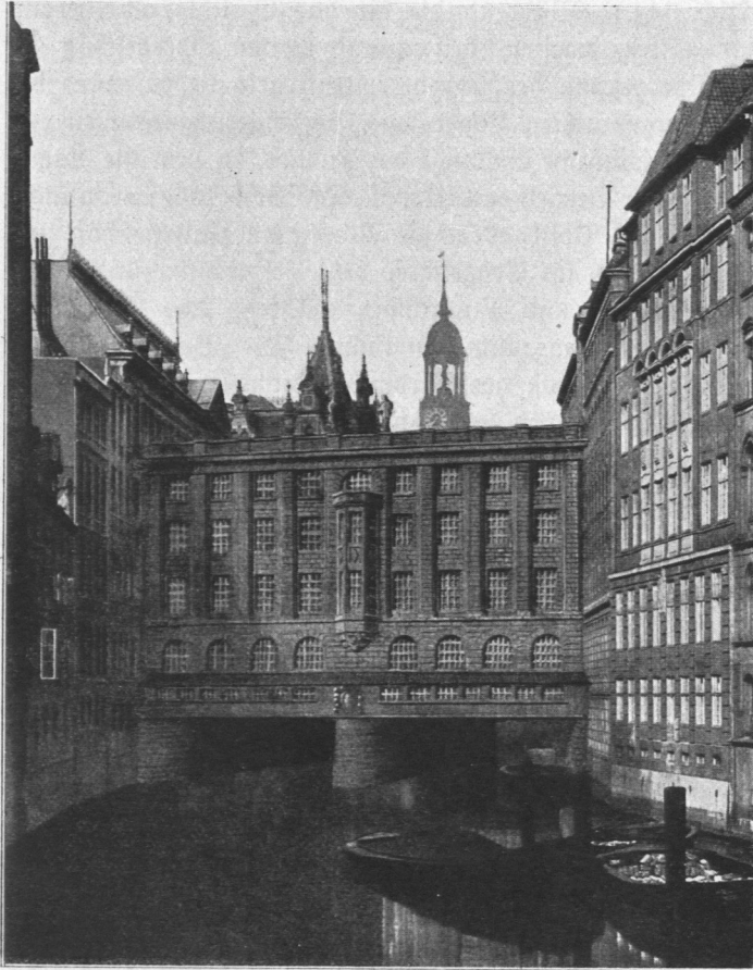
Abb. 347. Stadthaus, Ansicht vom Flet.