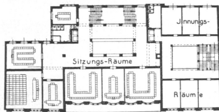
Abb. 343. Gewerbehaus, 2. Obergeschoß, Grundriß.

und zweckentsprechend gehalten werden. Die Sitzungszimmer erhalten teils Holzverkleidung, teils Leistenteilung mit Stoffbespannung und Riemenfußböden in Asphalt. Der große Sitzungs-saal und der Sitzungs-saal der Gewerbekammer sollen Eichenparkettfußböden, Stuckdecken und einfache dekorative Malereien erhalten. Die Beheizung wird mittels Niederdruckdampfheizung erfolgen. Für die größeren Säle ist die Zuführung vorgewärmter und filtrierter Frischluft mittels elektrisch betriebener Ventilatoren vorgesehen. Neben den Treppen vermitteln zwei Paternosterpersonenaufzüge den Verkehr zwischen den Stockwerken. Die Baukosten sind auf rund 912000 Mark veranschlagt, für 1 cbm auf 22,85 Mark.