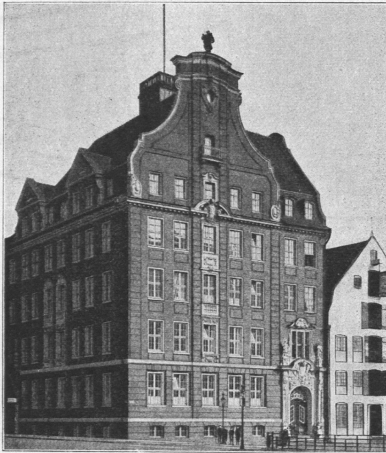
Abb. 335. Dienstgebäude für die Landherrenschaften, Ansicht.

Das Gebäude für die Landherrenschaften wurde im Jahre 1907 an der Ecke der Straßen Klingberg und Depenau (Abb. 335 und 336) errichtet und enthält im Keller-, Erd- und ersten Obergeschoß Räume für die Polizeibehörde. Das dritte Obergeschoß enthält die Räume für die Landherrenschaften sowie die Wohnung des Oberwachtmeisters. Im vierten Obergeschoß und dem ausgebauten Dachgeschoß befinden sich die Wohnräume für den Revierwachtmeister und den Hauswart sowie einige Diensträume der Landherrenschaften. Jede Raumgruppe hat einen besonderen Eingang und auch ein besonderes Treppenhaus erhalten. Die Bauweise des Gebäudes ist durchweg massiv, die Zwischendecken sind in Eisenbeton hergestellt. Die Erwärmung der Räume, mit Ausnahme der des Kellergeschosses, erfolgt durch eine Niederdruckdampfheizung. Für die zu beheizenden Räume des Kellergeschosses ist Ortsheizung vor-