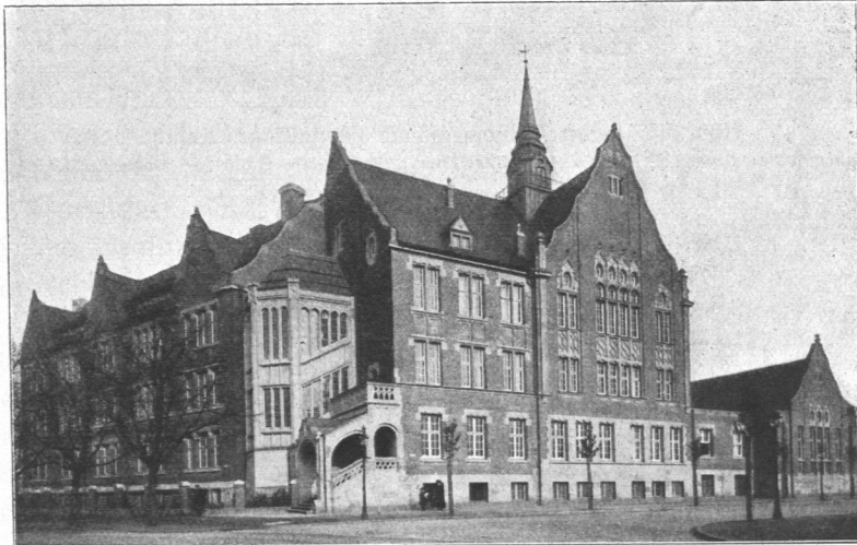
Abb. 284. Höhere Mädchenschule Lerchenfeld, Ansicht.

Entwurf: Bauinspektor Dr.-Ing. Erbe. Ausführung: Bauinspektor Bauer und Baumeister Raegel.