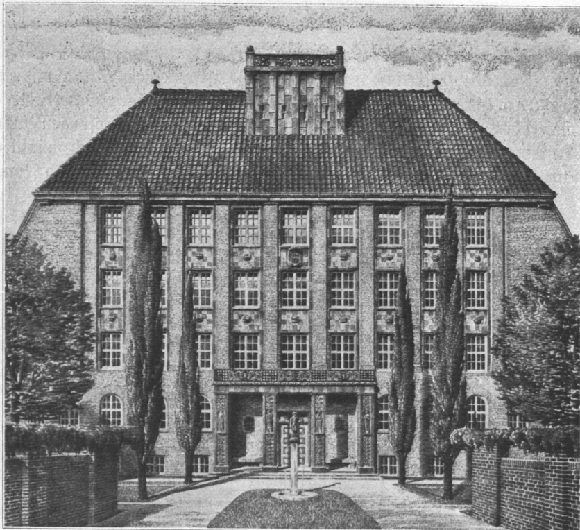
Abb. 282. Realschule Uferstraße, Ansicht.

Unter den vielen Großstadtaufgaben, die heute noch die Grundform ihrer Gestaltung ringen, hat sich in dem Bau der Schule, und zwar insbesondere in dem Bau der Volksschule, vielleicht am deutlichsten ein Typus herausgebildet, der unserer augenblicklichen Anschauung über diese Bauaufgabe klaren Ausdruck gibt.