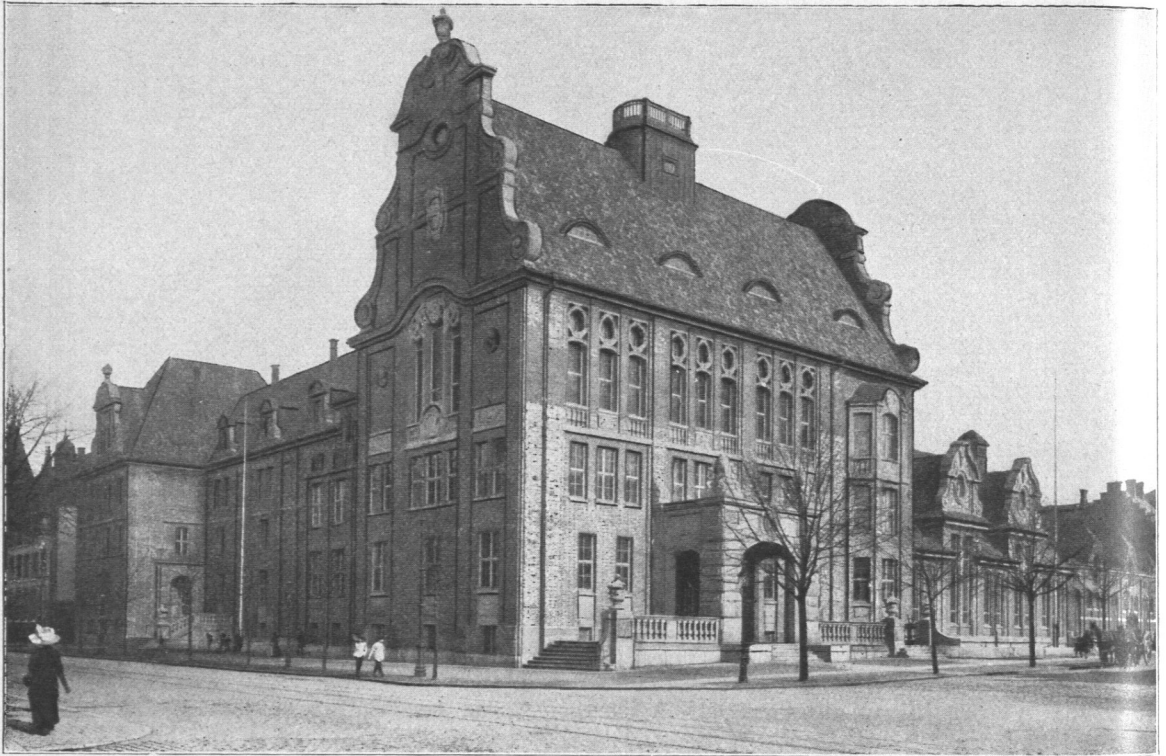
Abb. 259. Heinrich-Herg-Realgymnasium, Ansicht.

Entwurf: Bauinspektor Dr.-Ing. Erbe. Ausführung: Bauinspektor Schmidt und Baumeister Reith.