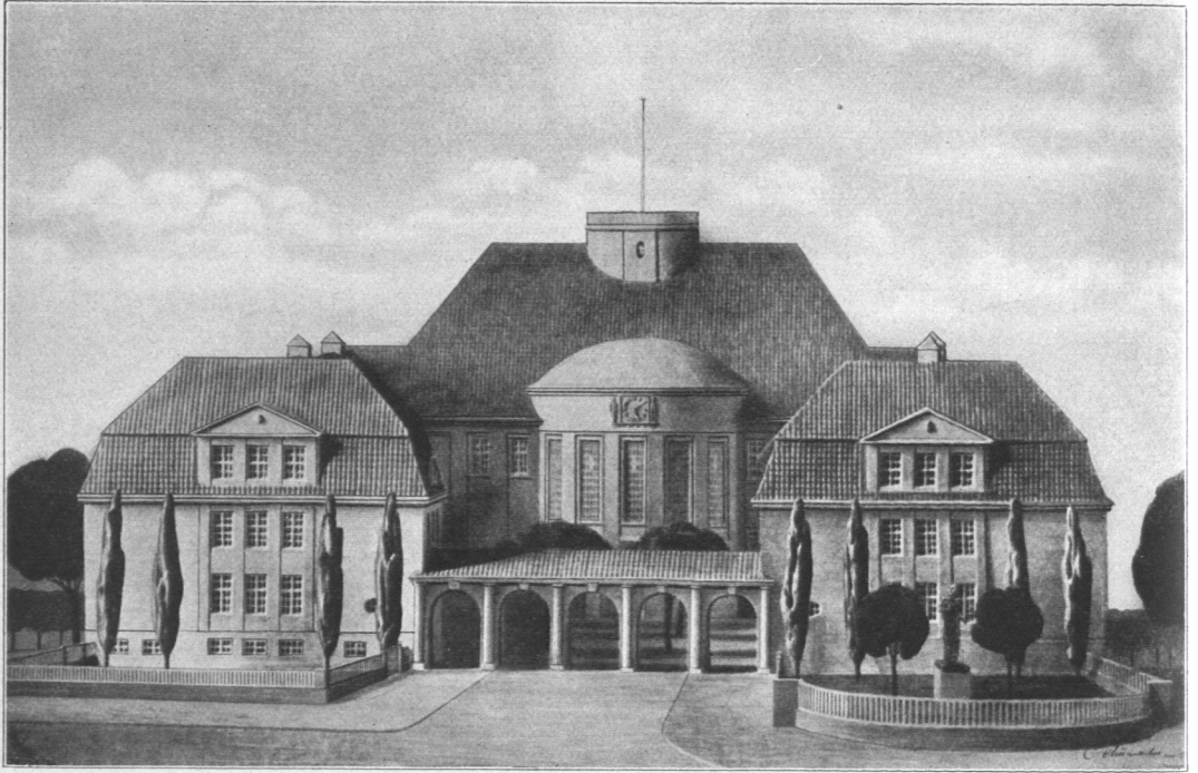
Abb. 254. Gelehrten Schule des Johanneums, Vorderansicht (nach Modell). Entwurf: Baudirektor Schumacher. Ausführung: Baumeister Lindenkohl.