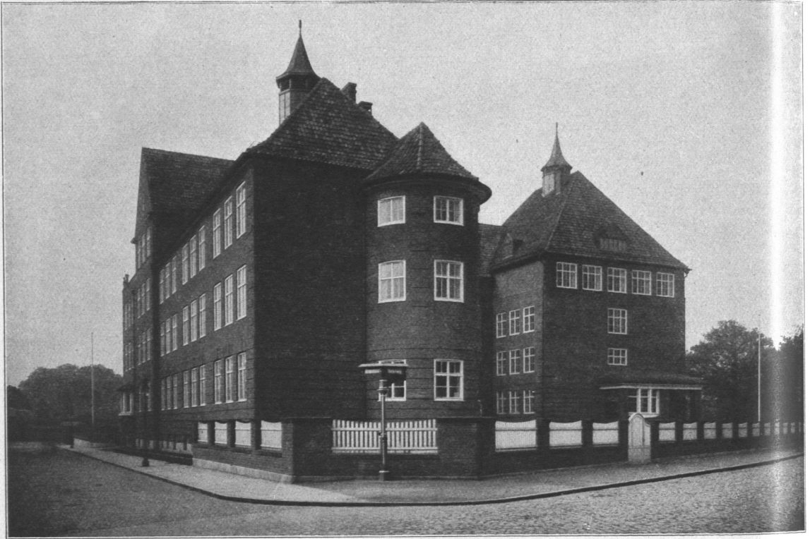
Abb. 219. Volksschule Morahntstraße, Ansicht.

Entwurf: Bauinspektor Dr.-Ing. Erbe. Ausführung: Baurat Janssen und Baumeister Dr.-Ing. Otto.