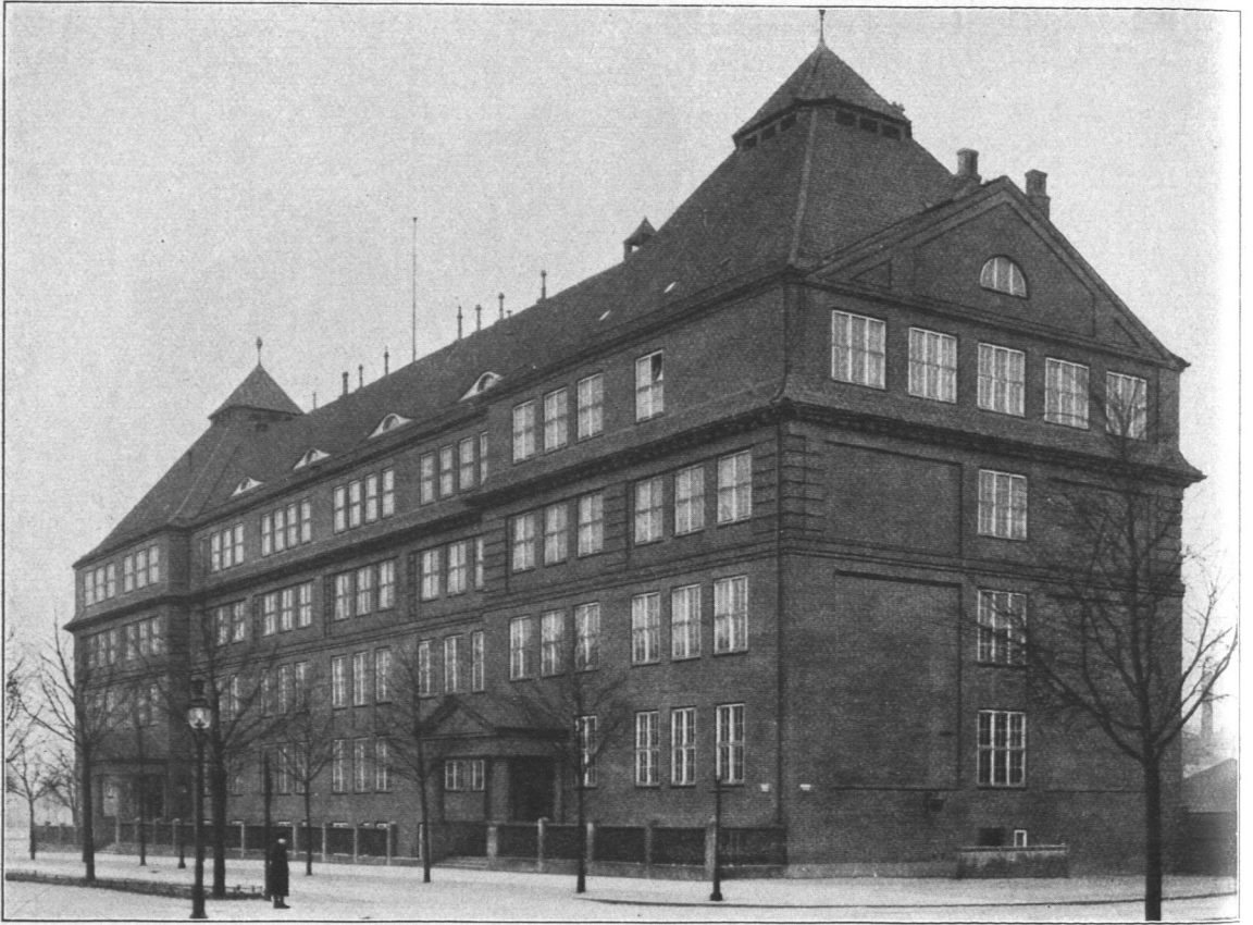
Abb. 215. Volksschule Schleidenstraße, Ansicht.

Entwurf: Bauinspektor Dr.-Ing. Erbe. Ausführung: Bauinspektor Ebeling.