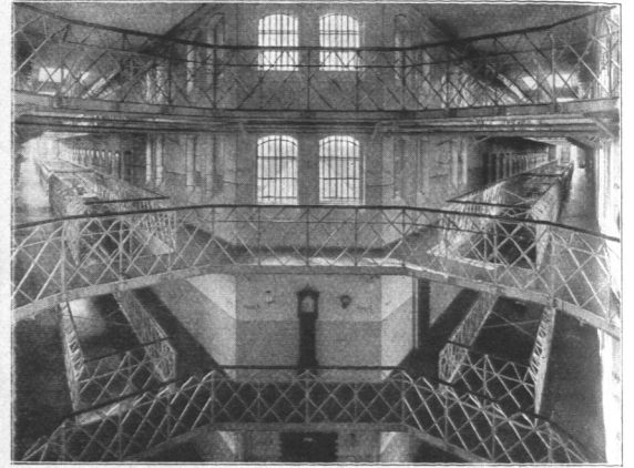
Abb. 194. 2. Gefängnis Fuhlsbüttel am Hasenberge, Fluranfsicht.

flügel gegenüberliegenden beiden Flügelhälften befindet sich im Erdgeschoß ein Baderaum für die Gefangenen und oberhalb in der Höhe des 1. Obergeschosses ein Schulraum. Durch die Mittelhalle findet mittels der hier auslaufenden und an den Wänden der Halle herumgeführten Flurgalerien die Verbindung zwischen den verschiedenen Flügelbauten statt, auch lassen sich von hier aus alle Flügelbauten übersehen. (Abb. 194.) In der Galerie des Erdgeschosses, und zwar in der Längsachse des Verwaltungsfügel, ist ein kanzelartiger Vorbau hergestellt, von dem aus ein Wärter die Wache über den gesamten Zellenflügel ausübt.