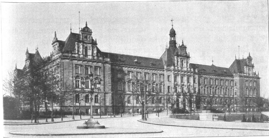
Abb. 177. Ziviljustizgebäude, Ansicht.

Da der Bau des Oberlandesgerichts die beiden seitlich gelegenen Geschäftshäuser des Zivil- und Strafjustizgebäudes in seiner Bedeutung überragen mußte, so wurde von den Architekten