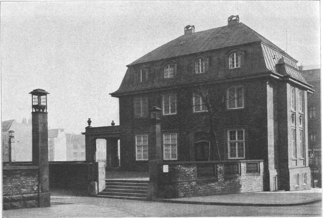
Abb. 113. St.-Michaelis-Kirche, Pastorat.