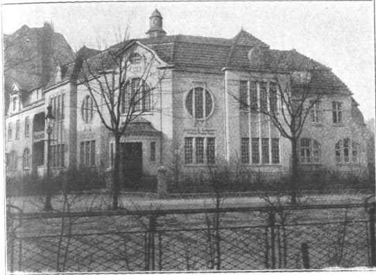
Abb. 157. Stephan-Kempe-Saal, Ansicht.

Hauptsächlich für den sonntäglichen Gottesdienst wurde in dem entfernten Hammerbrookbezirk des St.-Katharinen-Kirchspiels von dem Architekten Balzer 1909 der Stephan-Kempe-Saal (Abb. 157 bis 159) mit 236 unteren und 130 Emporenplätzen erbaut. Seine seitlichen, unter den Emporen liegenden Teile können durch Rolläden abgetrennt werden und dienen dann als Konfirmandensäle für die anstoßend wohnenden beiden Geistlichen. Ein Küsterhaus mit Organistenwohnung vervollständigt die Gesamtanlage, die gewissermaßen in der Mitte steht zwischen einem Gemeindehause und einem Kapellenbau. (Bebaute Fläche des Saales 268 qm, des linksseitigen Pastorates 143 qm, des rechtsseitigen 159 qm und des Beamtenhauses 88 qm; Baukosten 155000 Mark.) Der Platz ist, wie Abb. 159 erkennen läßt, ungewöhnlich günstig am Brackdamm, Ausschlägerweg und an der Robinsonstraße gelegen, so daß die Pastorate jedes auch mit einem Vorgarten ausgestattet werden konnten. Rückseitig ergibt sich zwar nur ein Hof, von dem aus der Zugang zu den Konfirmandensälen stattfindet und der für den Wirtschaftsverkehr der einzelnen Häuser dient, indem auch die Küchen von dieser Seite zugänglich gemacht sind. Der Haupteingang in den Predigtstuhl befindet sich an der Ecke, so daß der Windfang durch die Rückwand von Altar und Kanzel gebildet wird. Die Orgel steht gegenüber auf der Empore.