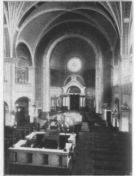
Abb. 140. Neue Synagoge, Innenansicht.

Ziegeln und rotem Mainsandstein ausgebildet. Die Kuppelbekrönung erreicht eine Höhe von 40 m. Im Innern sind sämtliche Teile aus den edelsten Marmorarten und die Emporensäulen aus poliertem Granit. Die Türen sind aus Bronze in reicher Treibarbeit hergestellt und einzelne Flächen mit Glasmosaik geschmückt. Nach Norden liegt das große Gebäude der Talmud-Tora-Schule. Der Hauptbau der Synagoge hat 1025 qm, die Nebenteile haben 255 qm Fläche. Die Baukosten waren für erstere 440000 Mark und mit dem Schmuck des Allerheiligsten 500000 Mark, für die Wochensynagoge nebst Saalbau 60000 Mark.