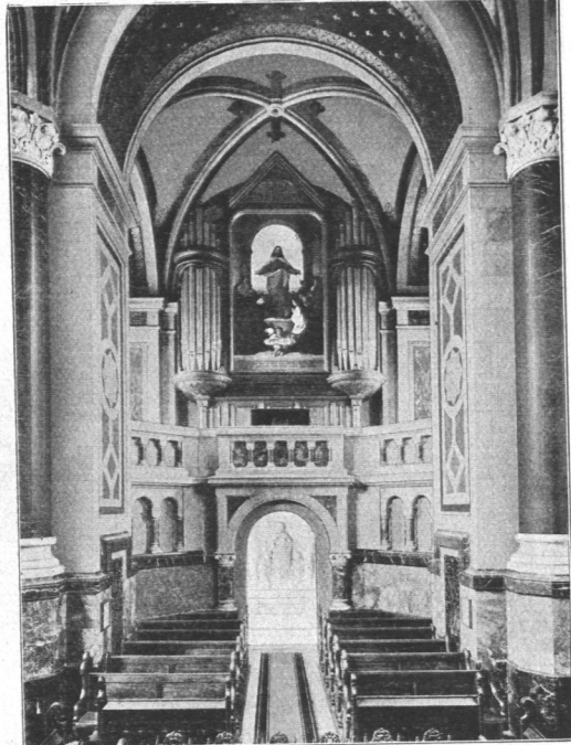
Abb. 137. Schröder-Stift-Kapelle, Innenansicht, Orgel.

nur 136 feste Plätze, sie ist in reichster Weise unter Verwendung seltener Marmorarten ausgeführt. An den Kirchenraum anschließend und, wie Abb. 136 zeigt, nur durch ein eisernes Gitter getrennt, ist die eigentliche Gedeknhalle ausgebildet, in der die Marmor-sarkophag des Stifters und seiner Gattin aufgestellt gefunden haben. Zwischen beiden ist die Mitte der Chornische durch eine hohe Figurengruppe geschmückt. Vom Vorraum aus führt