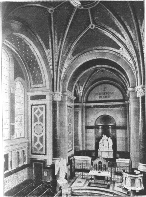
Abb. 136. Schröder-Stift-Kapelle, Innenansicht, Altar.