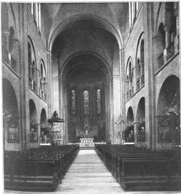
Abb. 120. Marien-Kirche in der Danzigerstraße, Innenansicht.