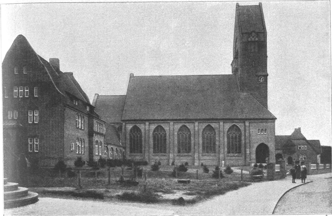
Abb. 115. Garnisonkirche in Cuxhaven, Ansicht.

einweihung des neuerstandenen Werkes fand am 19. Oktober 1913 in Anwesenheit des Deutschen Kaisers statt.