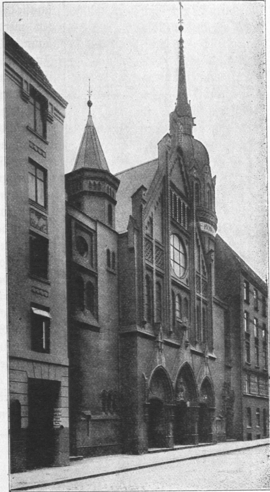
Abb. 106. Luther-Kirche in der Karpfangerstraße, Ansicht.