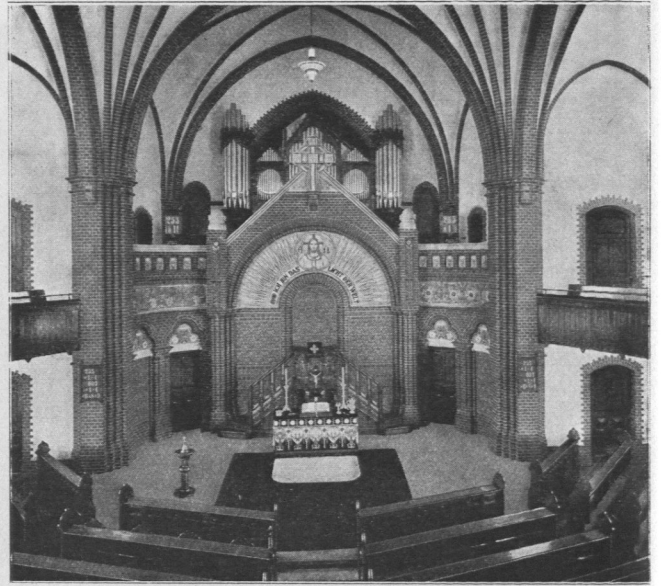
Abb. 98. Heiligengeistkirche in Barmbeck, Innenansicht.

bis 99.) Diese zeigt ebenfalls eine zentrale Plananordnung, und die großen Emporen erstrecken sich bis in den Turmraum hinein, so daß sich in der unteren Kirche 454 und auf den Emporen 327 Plätze ergeben. Einschließlich der 40 Sängerplätze auf der Orgel enthält die Kirche mithin 821 feste Sitzplätze. Im Innern zeigen die Wandpfeiler und Gewölberippen Ziegelverblendung.